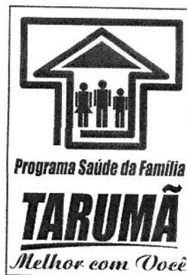
Programa Saúde da Família