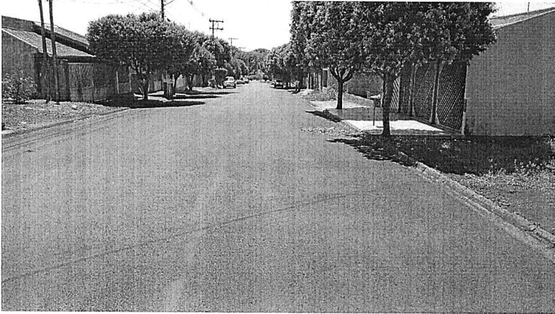
Figura 1 - Rua dos Pinheiros – sentido Rua Guaíçara.